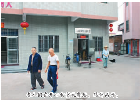
老人们在开心食堂就餐后,结伴离开。

三富村在当地并不富裕,村委会年收入只有4万元,如果仅靠村财政不可能做到这些。与现在城镇推行的