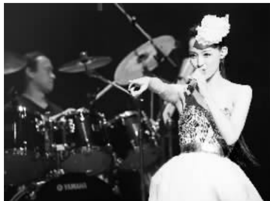
3月25日,台湾歌手范玮琪“给最亲爱的你”世界巡回演唱会在伦敦O2体育馆举行。