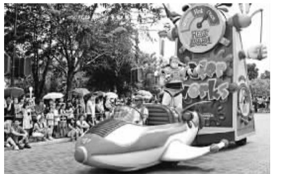
下图:香港迪士尼乐园内的节目表演。

对于内地游客,迪士尼表示,将安排3个月的原价优惠期,内地游客凡通过旅行社在6月30日前购买的门票均可享受原价优惠。