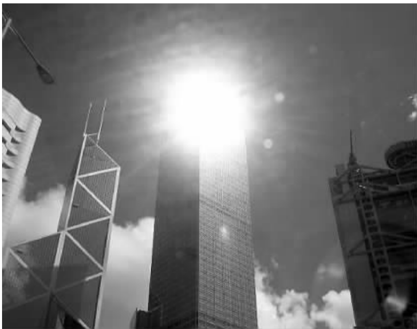
类似中环这样的光亮,在香港比比皆是。

香港以夜色璀璨享誉世界,一项研究发现,尖沙咀太空馆附近的光污染冠绝全球,超国际标准1200倍。