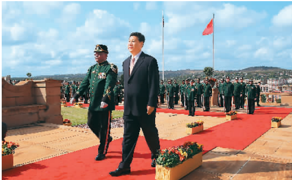
左上图:3月26日,国家主席习近平同南非总统祖马在比勒陀利亚举行会谈。 右上图:3月26日,南非总统祖马在比勒陀利亚联邦大厦前广场举行仪式,欢迎中国国家主席习近平访问南非。图为习近平检阅仪仗队。

联邦大厦广场,阳光明媚,和风送爽,中南两国国旗迎风飘扬,红地毯和绿草坪映衬出热烈喜庆的气氛。习近平和夫人彭丽媛抵达联邦大厦时,受到祖马总统和夫人热情迎接,军乐队鼓乐齐鸣。两国元首登上检阅台。军乐队奏中南两国国歌,鸣礼炮21响。习近平检阅南非仪仗队。祖马向习近平介绍莫特兰蒂副总统及多名政府部长。王沪宁、栗战书、杨洁篪等参加上述活动。