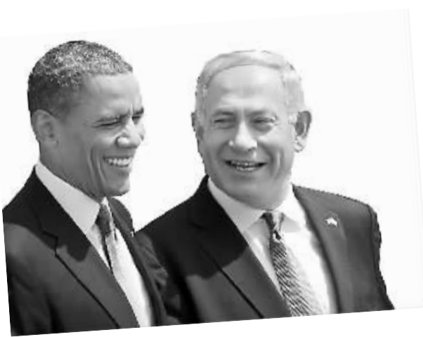
美国总统奥巴马与以色列总理内塔尼亚胡

今年1月，《今日以色列》发布的民意调查显示，超过半数的以色列人支持巴勒斯坦建国。