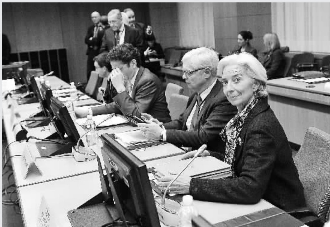
一位欧盟发言人25日说，塞浦路斯与“三驾马车”已经就100亿欧元（约合130亿美元）的救助协议要点达成一致。

本月23日，巴勒斯坦民族权力机构主席萨米尔·巴鲁克当天与美国方面探讨了巴勒斯坦和以色列举行探索性对话的问题，预计“对话筹备工作将于数日内展开”。