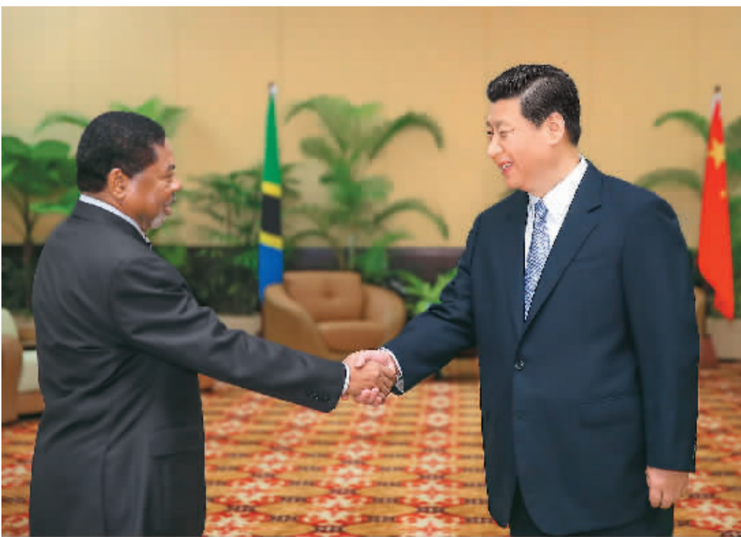
3月25日，国家主席习近平在达累斯萨拉姆会见桑给巴尔总统谢因。

姆卡帕表示，我曾多次访华，每次都深切感受到中国的发展，都坚定了我对探索走符合本国国情发展道路、加强坦中友好合作的决心。习近平主席的访问是坦中关系新的里程碑，必将有力促进两国合作。我愿继续为促进坦中关系作出贡献。姆卡帕表示南方中心愿加强同中国的合作。 王沪宁、栗战书、杨洁篪等参加上述会见。 当天上午，习近平主席夫人彭丽媛在基奎特总统夫人萨玛·基奎特陪同下参观了坦桑尼亚“妇女