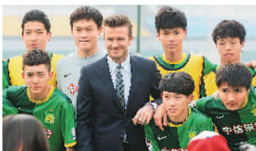
贝克汉姆与国安俱乐部青少年球员合影

贝克汉姆对记者表示：“中超不断地在向世界级的优秀联赛学习。这里拥有优秀的球员，狂热的球迷，它需要的是世界对它更多的关注与支持。我很愿意担任这个桥梁的角色。足球这项运动赋予我太多，我也希望借此身份同中国的青少年分享足球的快乐。相信这里有很多足球的好苗子，我希望能指