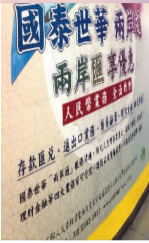
出人民币业务广告。配文图为台北各银行都在街头挂

为了避免剥“两层皮”,在两岸货币直通之前,到“地下钱庄”换钱是台商中公开的秘密。台商之所以愿意冒着“拿到假钞”的风险,通过地下钱庄兑换人民币,为的就是“汇损较低”,不希望经历“新台币—美元—人民币”两次汇兑。而在岛内,也曾因迟迟不能兑换人民币,导致地下钱庄生意兴隆,人民币假钞泛滥。