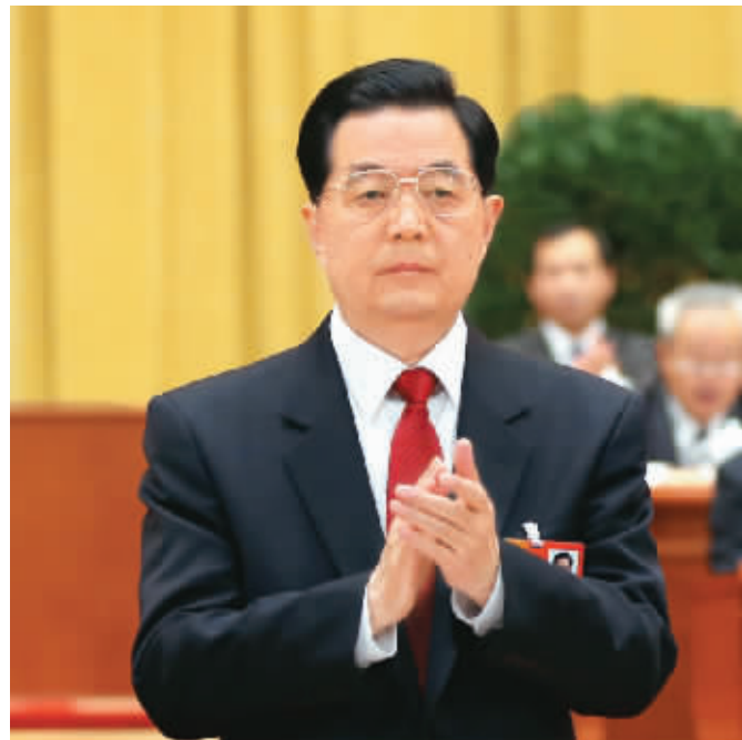
在国家主席习近平的提议下,全场代表以热烈的掌声向胡锦涛同志表示衷心的感谢和崇高的敬意。胡锦涛起身致意。

胡锦涛吴邦国温家宝贾庆林在主席台就座 李克强俞正声刘云山王岐山张高丽出席 通过关于政府工作报告的决议等 习近平发表重要讲话 张德江主持