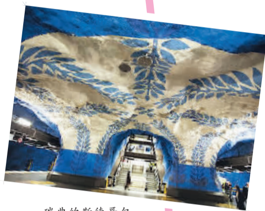
瑞典的斯德哥尔摩地铁站的“洞穴”造型