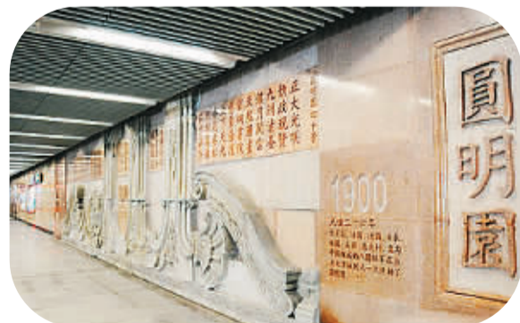
北京4号线地铁圆明园站