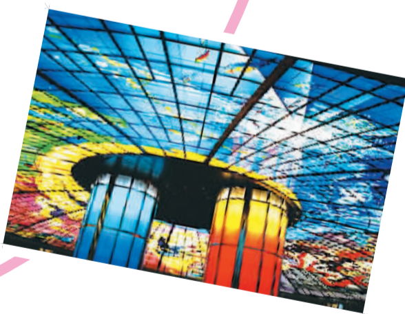
台北高雄美丽岛捷运站