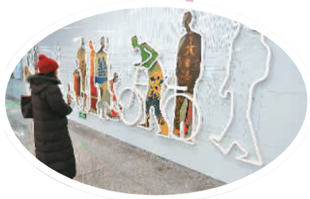
北京10号线地铁潘家园站