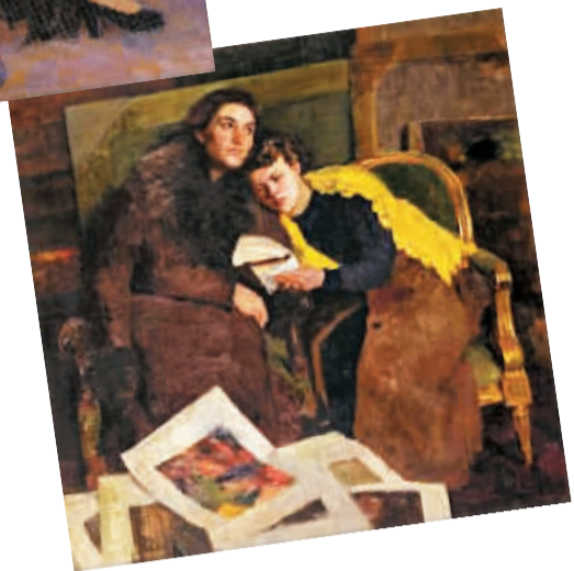
两姐妹 罗工柳 (华茂美术馆藏)