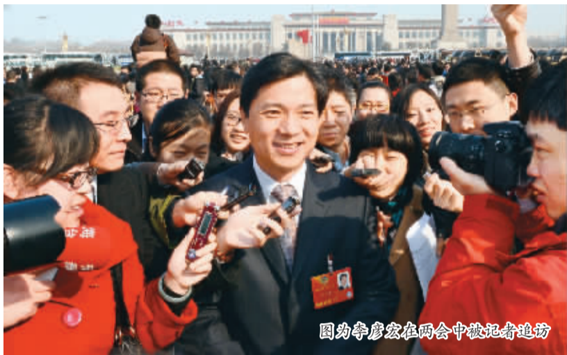
图为李彦宏在两会中被记者采访

李彦宏，有技术，有眼光，有魄力，有自信，更有危机感。虽然已经占据了国内搜索市场70%的市场份额，但却异常冷静。他向公司员工提出狼性文化。