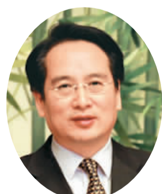
美国团团长、国务院侨办副主任谭天星：

希望通过“文化中国·四海同春”的平台，慰问海外侨胞，凝聚海外侨胞的人心，增加其对中华文化的了解和热爱；同时，演出吸引大量当地观众前来观看，通过他们向当地主流社会介绍中国发展，增进中外友好交往。