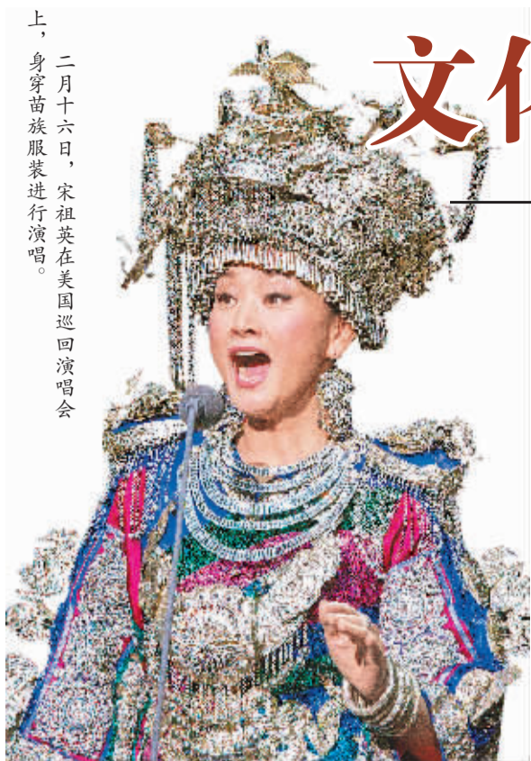
二月十六日，宋祖英在美国巡回演唱会上，身穿苗族服装进行演唱。

这是一次文化的迁徙。11个艺术团组，超豪华的演出阵容，足迹遍布美洲、欧洲、大洋洲、亚洲、非洲等地。