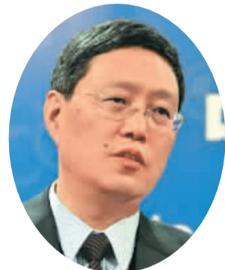
大洋洲团团长、国务院侨办副主任任何亚非：

中华文化是海外侨胞灵魂的寄托，是海外侨胞与祖国血脉联系的精神纽带。国务院侨办将继续秉承“以人为本、为侨服务”的宗旨，通过举办“文化中国·四海同春”等丰富多彩的活动，服务海外侨胞，做好侨务工作，为实现中华民族伟大复兴的“中国梦”不懈努力。