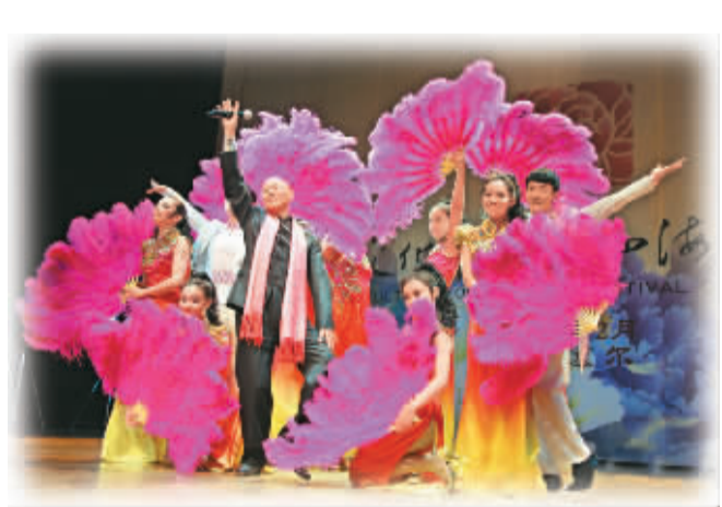
香港著名艺人罗家英参与“四海同春”欧洲团在比利时进行演出。

耳熟能详的歌曲《万水千山总是情》、《月亮代表我的心》；经典京剧选段《贵妃醉酒》；融口技、演唱、舞蹈于一体的经典相声《祈福》；优美动听的歌曲《天路》，饱含深情的歌曲《父老乡亲》……罗家英、胡文阁、奇志、阿鲁阿卓、刘一祯、周文健等艺术家为慕尼黑1200名观众奉上一场视听盛宴，剧场里不时响起如潮水般掌声、笑声和喝彩声。