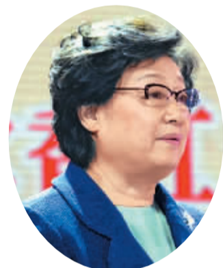
全国政协副主席、国侨办主任李海峰：

中华文化是海外侨胞灵魂的寄托，是海外侨胞与祖国血脉联系的精神纽带。国务院侨办将继续秉承“以人为本、为侨服务”的宗旨，通过举办“文化中国·四海同春”等丰富多彩的活动，服务海外侨胞，做好侨务工作，为实现中华民族伟大复兴的“中国梦”不懈努力。