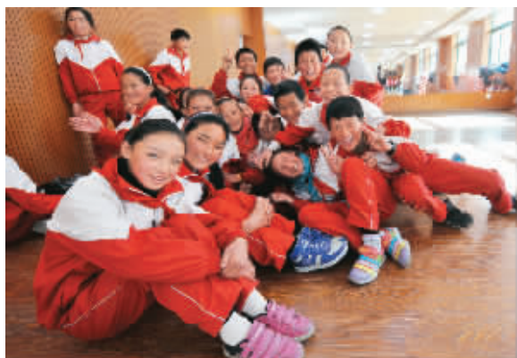
图为德钦县第一小学的一些藏族学生面对镜头露出笑容。

云南省迪庆藏族自治州德钦县第一小学位于滇藏交界处的梅里雪山脚下,这座海拔3300多米的高原小学校,篮球场、足球场、计算机室、实验室、课外活动室一应俱全。当地政府每年向农村学生发放高原农牧民子女学生生活补助和营养餐补助,每名学生每个月补助300元,全州共有5万多名农牧民子女从中受益。这些藏族农牧民孩子可以享受到优质的教育资源,在现代化的教室里专心学习,健康快乐地茁壮成长。