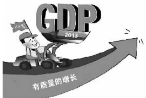
2013年GDP增长目标为7.5% 赵乃育作