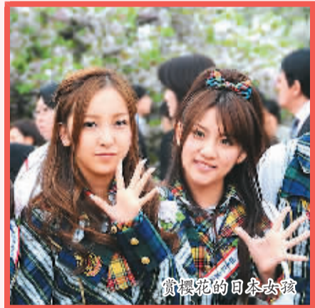
赏樱花的日本女孩

“日本女性的政治地位绝对不如男人。”张玥说：“首相田中角荣的女儿田中真纪子，已经算是日本政坛极有魄力女性了，可在这样的大环境下，还是很难有大的作为。”婚后继续工作、参加社会活动的女性少，也使得日本女性的社会经济地位一直高不起来。虽说目前参加工作的都是学历较高的30多岁知识女性，但大部分是工薪阶层，企业家、高管是凤毛麟角。