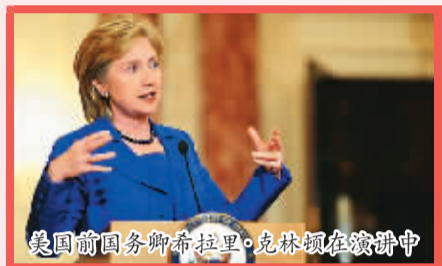
美国前国务卿希拉里·克林顿在演讲中

今天的美国女性，无论出生在什么样的家庭都希望接受高等教育。就连许多低收入年轻的母亲，也在学费低廉的社区学院上大学。美国获得高中毕业文凭的人群中，女性占了52%。获得大专学位的人群