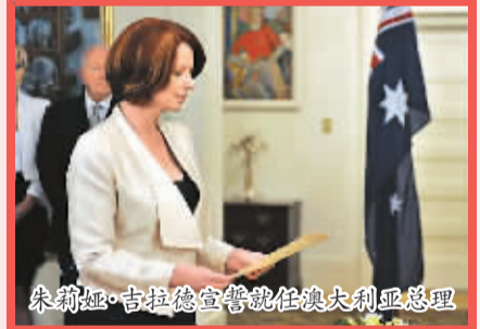
朱莉娅·吉拉德宣誓就任澳大利亚总理

2010年6月24日，朱莉娅·吉拉德当选为澳大利亚总理，成为该国历史上首位女性总理。女性在澳大利亚的社会地位可见一斑。吉拉德投身政治20多年，她一直积极主张女性参与国家政治与社会革新。也有澳大利亚当地女性结婚后，在家当主妇而不再参加社会工作。但华裔妇女