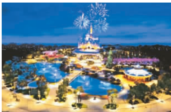
上海迪士尼乐园模型局部。

本报上海3月7日电(记者曹玲娟)备受关注的上海迪士尼项目，今天首度向外界发布未来蓝图，上海迪士尼乐园模型的一部分(模型与实际比例为1:100)得以亮相，包括首次呈现的位于主题乐园中央占地11公顷的美丽绿地，以及乐园的标志性景点“奇幻童话城堡”的近距离效果。