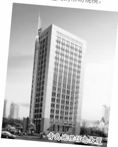
青岛地理信息大厦

在这一背景下，全球企业工程软件和地理空间技术解决方案供应商——瑞典海克斯康鹰图股份有限公司落户青岛，并以青岛为基地抢占国内地理信息产业蛋糕，可谓正逢其时。从另一方面来讲，其落户青岛后，有助于提升青岛地理信息产业科研和产业化实力。