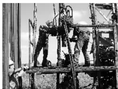
青岛金王集团的美国油气田钻井施工现场

“走出去”引领战略有助于推动“引进来、走出去”相结合的双向投资贸易，今年我们将启动设立境外“青岛工商中心”，重点选择在德、韩、日、美、俄、港、台、新加坡等国家和地区的8个城市，通过“青岛工商中心”，为青岛企业“走出去”提供服务，并兼顾引资、引智，促进海外企业来青投资和海外人才引进。