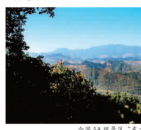
全国5A级景区、“东方雕塑馆”——麦积山石窟

一是把做大产业集群、增强经济实力作为第一要务。坚持实施“工业强市”战略，加快天水经济技术开发区扩区扩容，力促33户工业企业“出城入园”，抓好23个省列和76个市列重点项目建设，推动与央企及知名企业签约项目的落地实施，培育壮大六大主导产业集群。