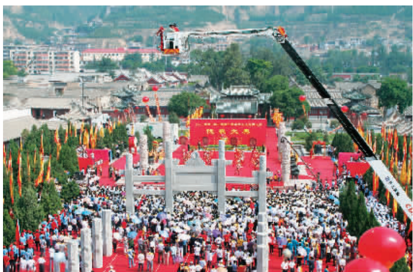
甘肃省祭典中华人始祖伏羲大典现场

一是天水具有良好的成矿地质条件。天水地处塔里木—华北板块与华南板块的结合带，涉及北祁连东段、北秦岭西段以及中秦岭北部等三个二级大地构造单元，成矿地质条件良好，是陕甘川矿产资源富集区的组成部分，已发现的矿种有40多种，其中，大型矿床5处、中型矿床6处、小型矿床多处；查明金矿资源储量1.014吨，铁矿3500多万吨，铜矿12.5万吨，钼矿16.1万吨，铅锌矿3.75万吨，水泥灰岩3亿吨，白云岩5000多万吨。另外还存在着大量的矿化点、物化异常区，亟待进一步勘查开发。截至目前，全市共设置探矿权140个，采矿权240个。其主要特点是：贵金属矿产具有潜在优势，主要矿产资源种类多、矿床相对集中，地热资源开发利用前景看好。二是天水市具有实力雄厚的地勘队伍。全市聚集了多家不同专业的地质勘查单位，是全省地勘单位最多、地勘人员最多、地勘门类最多的市之一，聚集了门类齐全的6家地质勘查单位，在职工