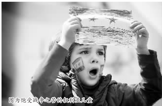
图为饱受战争之苦的叙利亚儿童

Art 13 伦敦艺术博览会于3月1日在英国首都伦敦拉开帷幕。由艺术门（Pearl Lam Galleries）带来的中国抽象艺术家朱金石的大型装置作品《船》成为此次艺术展的一大亮点。在2月28日媒体开放日当天，该作品受到众多媒体关注。图为当天工作人员在观看大型装置作品《船》的布展情况。《船》是由细竹、棉线和8000张宣纸组成的12米大型装置作品，由20名工作人员耗时3天安装完成。