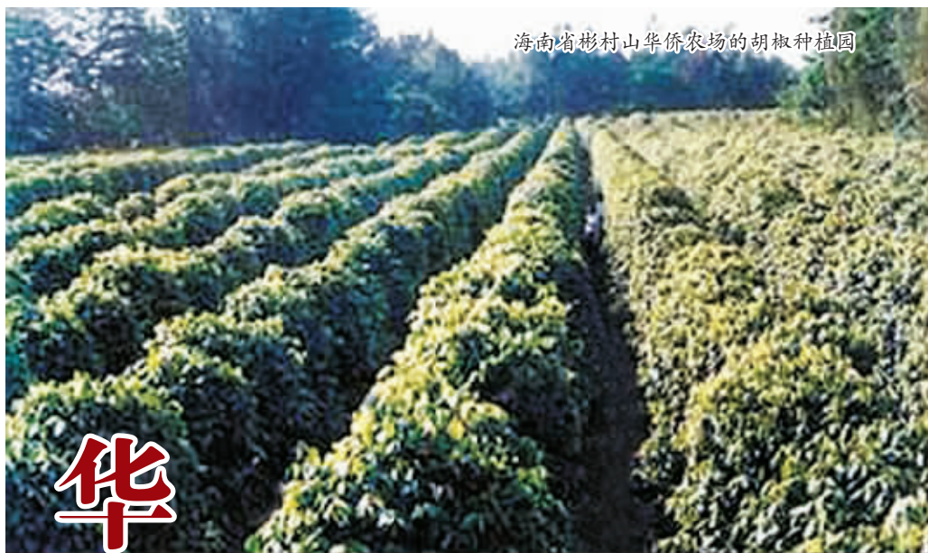
海南琼海彬村山华侨农场的胡椒种植园