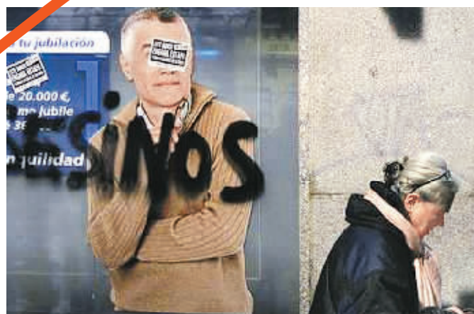
▼西班牙马德里银行玻璃墙被人喷上“暗杀者”的涂鸦

面对着千疮百孔的经济状况、居高不下的失业率以及略显缺乏诚意的《移民法》改革提案，要想移居西班牙，人们还需三思而后行。