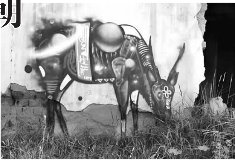
香格里拉古庙里的涂鸦作品