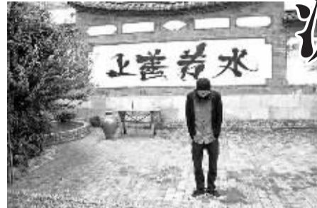
SINIC在丽江古城一面墙壁上写了四个大字