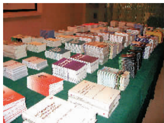
图为英文、法文、阿拉伯文等8个语种介绍此次两会的小册子。

减少200万元的支出。另外,两会新闻中心副主任、中国记协书记处书记祝寿臣介绍,新闻中心网页将分别及时公告各次全体会议、团组开放、记者会等信息。为方便记者深入采访报道代表提出的建议和代表团审议情况,人大新闻中心网页开辟了记者服务专区,将及时向记者提供代表团简报和代表建议摘编。