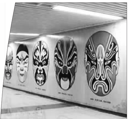
地铁内饰中的中国元素