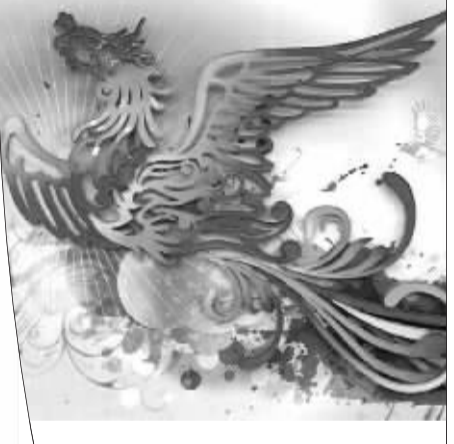
地铁10号线的新春装饰