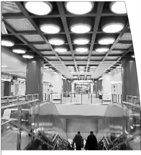
地铁8号线鼓楼大街站一景