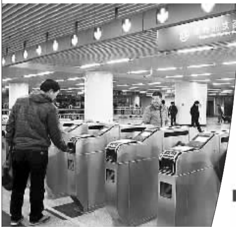
地铁9号线北京西站进站口