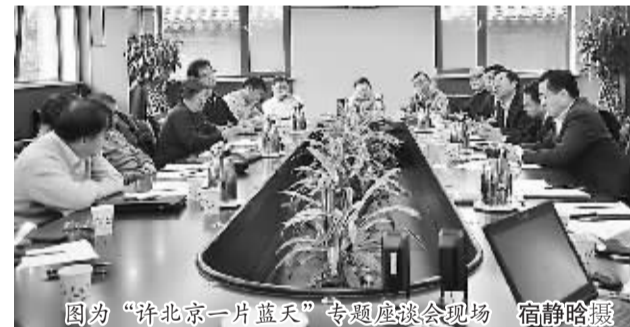
图为“许北京一片蓝天”专题座谈会现场

会上各位专家对PM2.5的监测治理问题从城市规划、交通规划、能源利用等发表了意见。PM2.5问题是全社会关注的热点，海归又一次站在新的角度为社会公共问题贡献自己的热情。