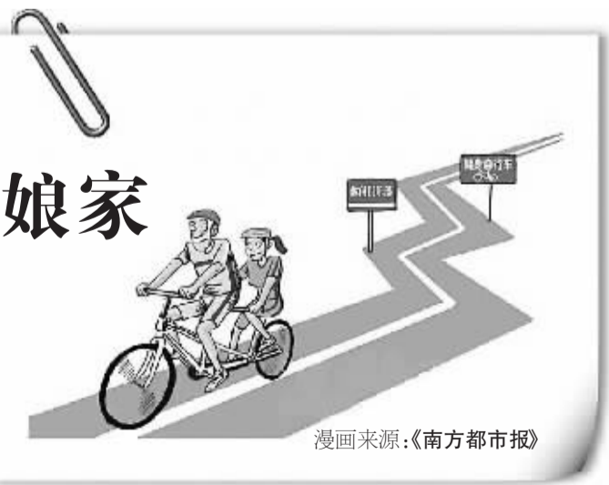
漫画来源：《南方都市报》

问题。但习惯并不等于认可，堵车和空气污染已经严重影响了中国社会的正常运行，使人们工作效率降低，生活质量下降。在国外生活过的海归自然会身体力行，用国外环保快捷的出行理念，影响到身边的每一个人。