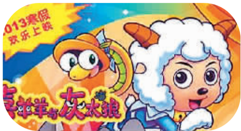
《喜羊羊与灰太狼之喜气洋洋过蛇年》海报

本报北京2月19日电(记者刘阳)记者从广电总局电影局了解到,今年春节初一至初六期间,全国电影票房突破7.6亿元,观影人次达1.925亿,放映近50万场,单日最高票房突破2.2亿元,均创历史新高。