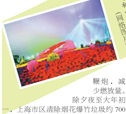
大年初一的广州音乐灯光秀

截至除夕,北京市烟花爆竹销售量比去年同期下降近四成;在上海,不少市民定时定点燃放。