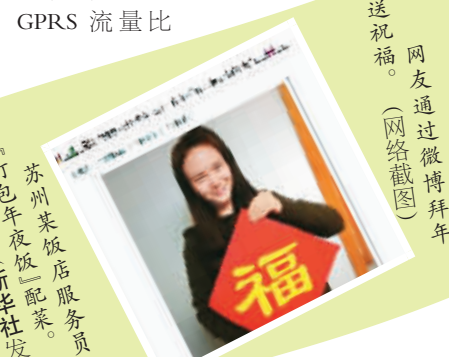
网友通过微博拜年送祝福。

除了电话拜年、短信拜年,越来越多的人在春节期间用微信、飞信、微博等方式拜年送祝福。广东移动相关数据显示,这些新方式引发数据流量的暴增,除夕全天GPRS流量比