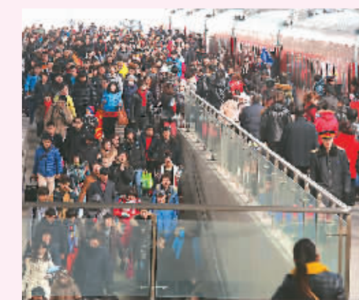
图为2月15日,旅客步入大连站出站通道。

公路 客运量达到8451万人次 水路 客运量达到151.9万人次 铁路 预计发送741万人次 航空 运送旅客超过115万人次