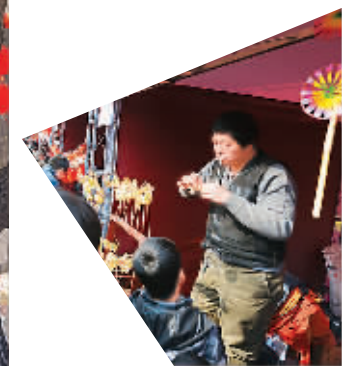
左图:龙潭庙会上人头攒动。右图:艺人在表演吹糖人。