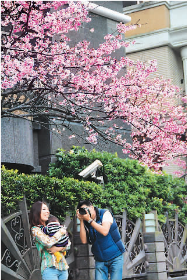
春节在即，台北樱花绽放，平添春意。图为台北闹市信义区的樱花树下，一家三口在拍照留念。