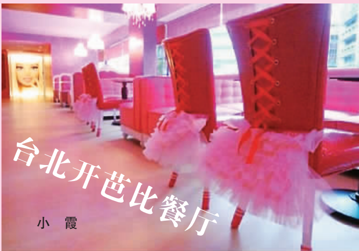
台北开芭比餐厅 小霞