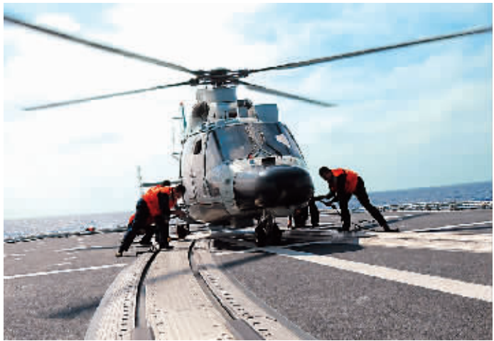
由海军北海舰队3艘军舰组成的中国海军舰艇编队连日来在南海海域重要岛礁间进行战备巡逻,开展多课目海上演练,并进行海上补给。编队2月7日夜间通过巴士海峡,继续在西太平洋海域进行远海训练。图为舰载直升机进行起飞前准备。