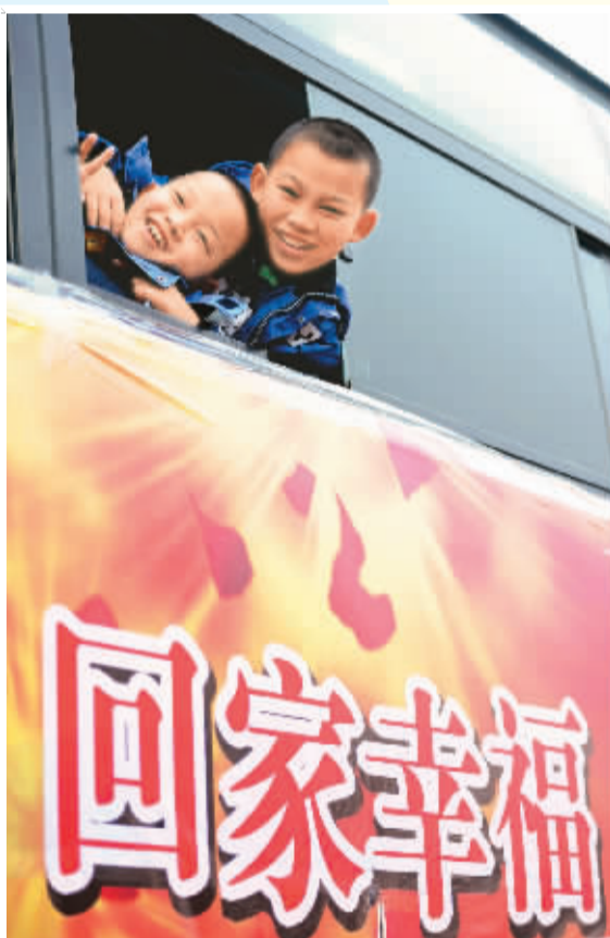
二月一日，两名农民工子女在安徽阜阳乘坐免费大巴。