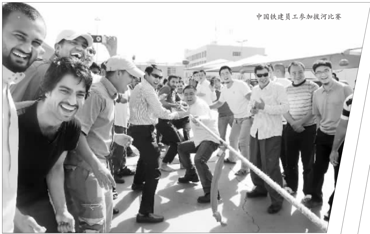
中国铁建员工参加拔河比赛

无论身在何处,有中国人的地方,便有春节,只不过在沙特过节多了平淡,少了气氛。每年这个时候,我们公司的领导是最忙碌的,为了让辛苦一年的员工们过