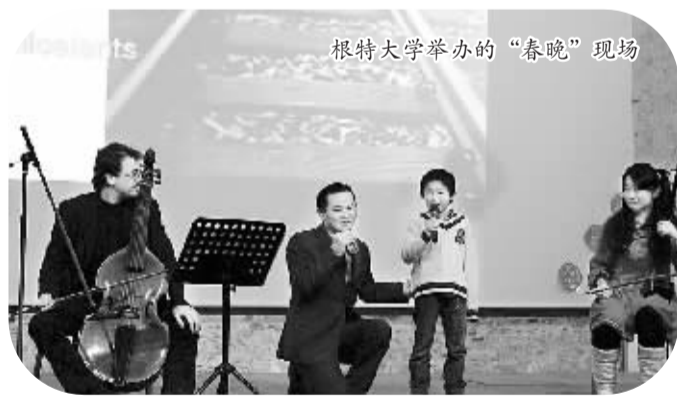
根特大学举办的“春晚”现场

看春晚,办春晚,是海外华人、留学生过春节的一件大事。想起去年我协助比利时根特大学学联办春晚的经历,真是有意思极了。