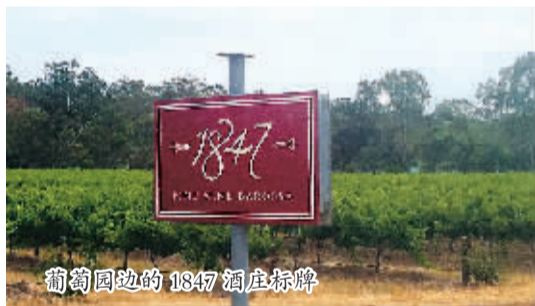
葡萄园边的1847酒庄招牌