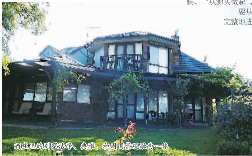
酒庄里的别墅洁净、典雅，和周围景观融为一体