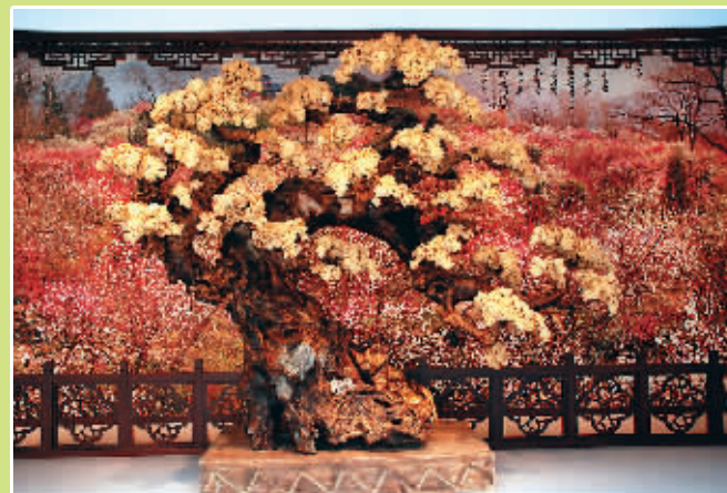
▲大型根雕形状酷似梅树

近日,中国梅花艺术中心于南京市梅花山景区落成,成为目前国内规模最大的梅花主题艺术馆。