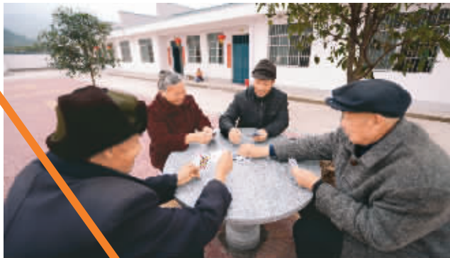
老人在新居大院打牌。

从2012年7月开始,江西省赣州市高效推进农村危旧土坯房改造,全力改善农村困难群众住房条件和生产生活条件。日前,首批10万户住房困难群众开始陆续搬进新居,彻底告别脏、乱、破的土坯房。