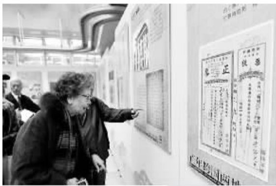
福建省档案馆举办“百年跨国两地书”侨批档案展

侨批承载了海外侨胞太多的情感，具有强大的生命力和影响力。在各界的积极努力下，中国侨批正从历史尘埃中走来，为世界增添独特色彩。