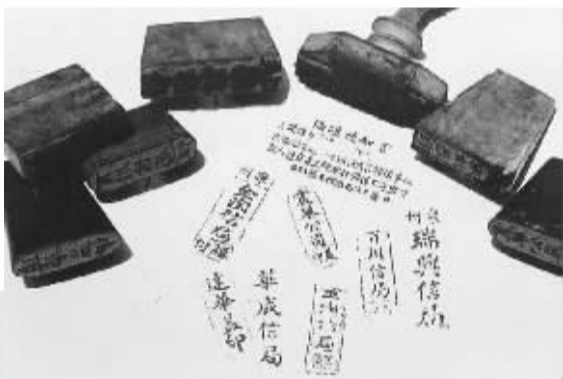
泉州侨批局专用侨批印章