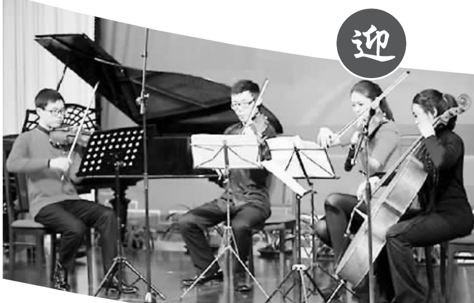
18日，中国驻使馆举行新春招待会。图为乐队正在演奏弦乐四重奏《春节序曲》。

“我们目前还没有撤离的计划，但是如果情况特别危急，还是决定暂时离开，等局势稳定后