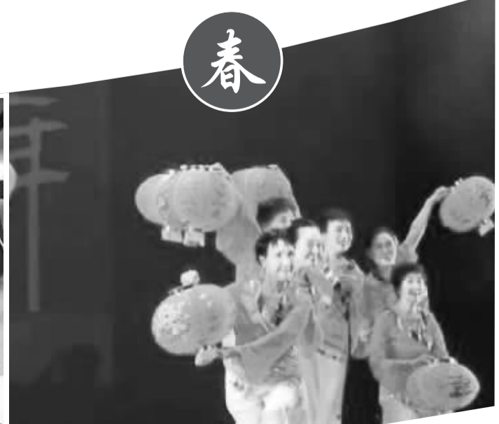
19日，美国休斯敦侨界举办春节晚会。图为老年人组成的夕阳红舞蹈队献上舞蹈《过年啦》。