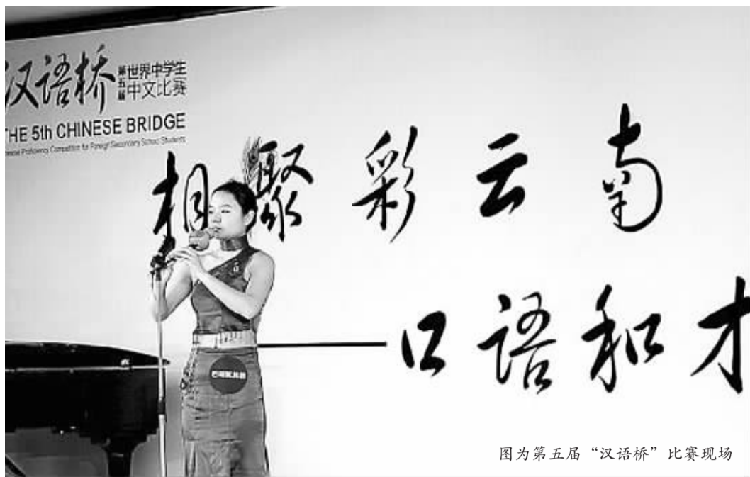
图为第五届“汉语桥”比赛现场