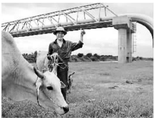
图为米坦格河畔放牛翁对中缅油气管道竖起大拇指。