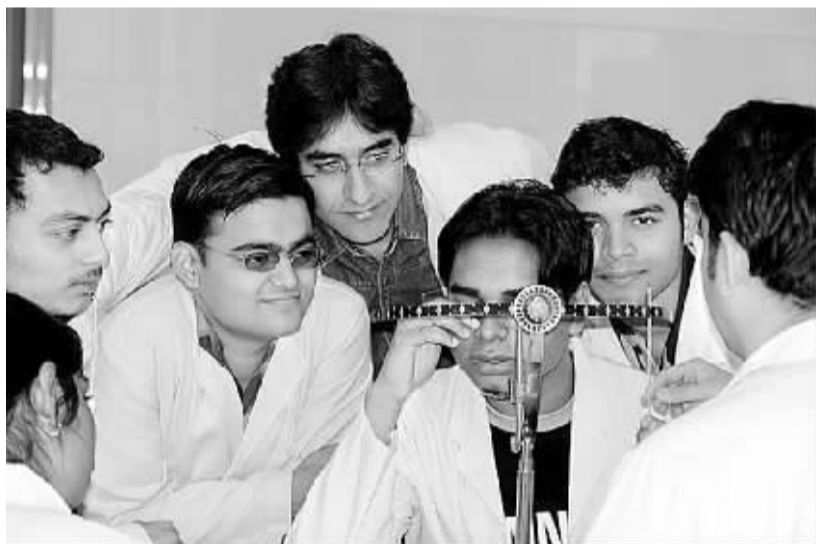
图为大理学院的南亚留学生

因此，从总体看，由于受内外因素的影响，2013年南亚地区的经济将面临巨大挑战，只能艰难前行。