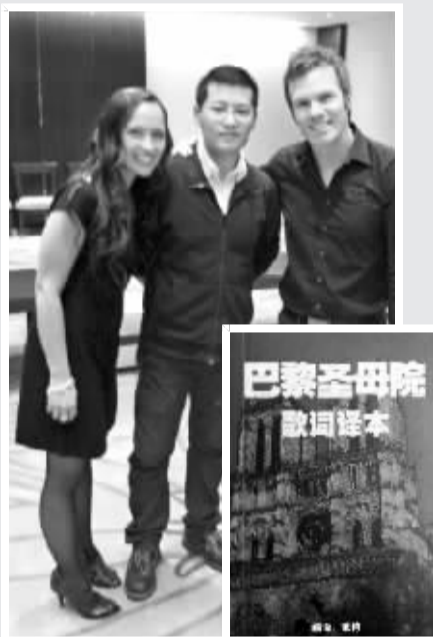
2011年，爱音客“歌特”翻译《巴黎圣母院》歌词并与演员合影