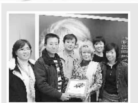
2006年，爱音客与著名音乐剧演员伊莲·佩姬（左四）合影。

特别值得一提的还有：2006年12月，“英国音乐剧第一夫人”伊莲·佩姬在上海举行独唱音乐会，该项目由爱音客“Lynette”策划，其他爱音客也贡献了极大的热情和力量。而最让爱音客骄傲和自豪的是：2008年3月，著名音乐剧作曲家安德鲁·劳埃德·韦伯60大寿之际，京津沪的爱音客策划、演绎并制作了送给韦伯的生日礼物——韦伯名曲合集CD。收到这一生日