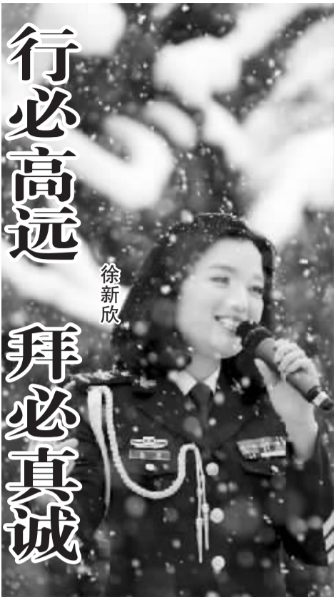
漫天鹅毛大雪中，白雪在石河子演出

2013年新春将至，两个月来，7支大拜年的小分队带领驻地军旅艺术家们，北上雪域高原，南下三沙海岛，东进茫茫林海，西出大漠戈壁，给基层官兵拜年，送去了问候，送去了祝福，送去了欢乐。