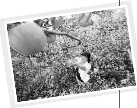
贵州省毕节市威宁彝族回族苗族自治县龙场镇树舍果场的苹果喜获丰收。

专家表示，稳增长仍然是今年我国经济的重要任务，而基建投资大幅增长、社会消费稳步增加以及去库存结束将是推动经济增长的主要内在因素，经济发展稳中有进的良好态势也将得以延续。同时，今年中国经济增长需要更加注重质量和效益，在新型城镇化将成为新的增长点的同时，需警惕房地产泡沫和贸易保护主义。