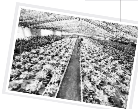
工作人员在江西省新余市的一处花卉苗木基地打理绿色植物。