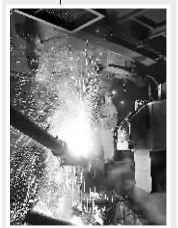
在东北特钢集团大连高合金线材生产区，一名员工在清扫注水口。