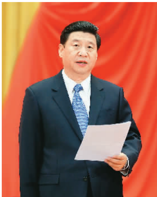
中共中央总书记、中央军委主席习近平主持大会。