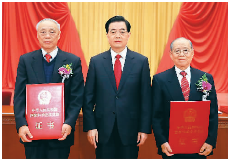
国家主席胡锦涛向获得2012年度国家最高科学技术奖的中国科学院院士、中国工程院院士郑哲敏(右)和中国工程院院士王小谟(左)颁奖。

胡锦涛习近平温家宝李克强刘云山出席大会并为获奖代表颁奖 习近平主持大会 温家宝讲话 李克强宣读奖励决定