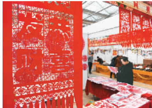
上图:市民在选购窗花、剪纸。 右图:市民在购置年货。 下图:市民在农博园内拍照留念。