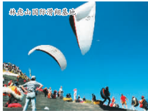
林虑山国际滑翔基地

我想，泽下村的平静不是意味着遗忘，而是代表着铭记。“大音希声，大象无形。”老子之言恰好诠释了泽下村的现状。平静可能表明山村对刘洋的记忆，由张扬收为内敛，由喧哗变为静思，从眉宇口舌间流入内心，深渗到一方土地里。