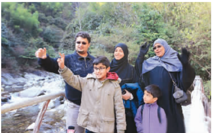
1月1日,外国游客在婺源县大鄣山景区拍照留念。

据新华社南昌1月3日电 (记者沈洋) 江西婺源县丰富多彩的民俗文化受到境外游客青睐。记者从婺源县旅游部门获悉,元旦期间,来自韩国、美国等国家和地区的1000余名游客在婺源游乡村、赏民俗、迎新年。 婺源民俗文化资源丰富,不仅有徽剧、傩舞、抬阁等古戏剧、古音乐、古舞蹈,还有砖雕、石雕、木雕、歙砚制作等传统工艺。 婺源地处江西省东北部,与安徽、浙江两省交界,被誉为“中国最美丽的乡村”。婺源以山水、桥、亭、滩等组合的自然景观,有着世外桃源般的意境。