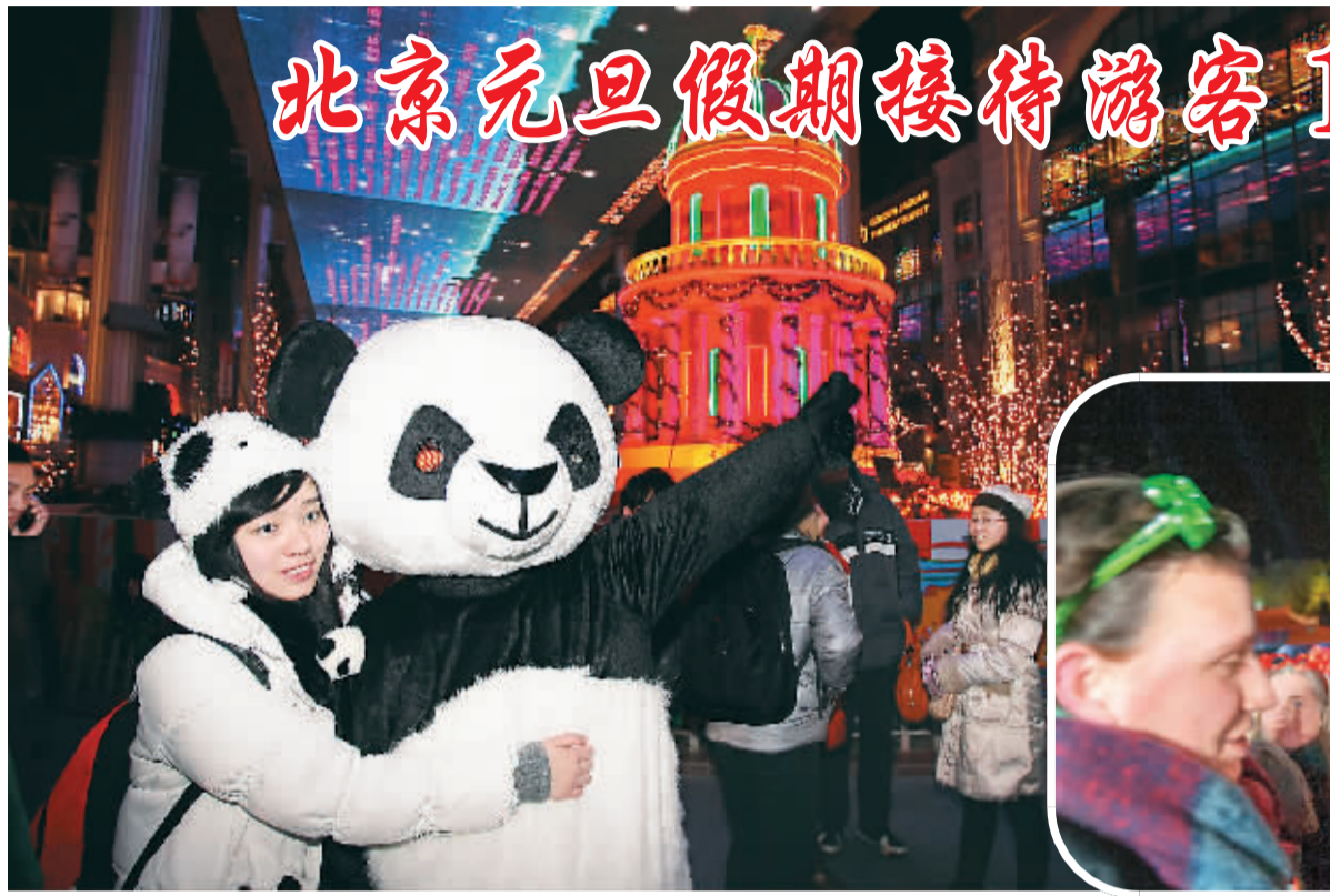
▲一名游客在北京世贸天阶与熊猫人偶合影。 ▼几名外国游客在颐和园参加新年倒计时活动。