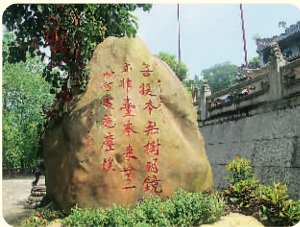
国恩寺山门前的石头上刻有六祖惠能的偈语。

新兴正在把禅文化之旅打造成名副其实的养心之旅,让游客无论是泡温泉、品香茶还是赏美景,皆能感受到禅意,既能玩得尽心,住得舒心,食得放心,而且可以行得安心,购得诚心,充分感受“中国禅都”的独特魅力。