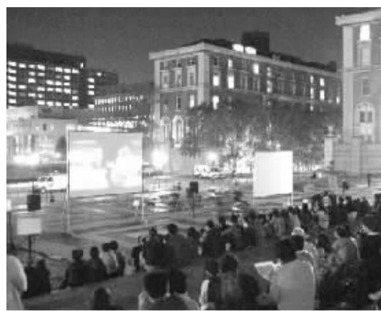
上图：10月5日，《探望》在哥伦比亚大学校园首映，不少学生到场观看。