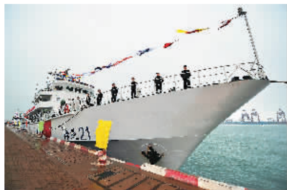
上图:“海巡21”后甲板的舰载直升机停机平台。 左图:“海巡21”船列编仪式。