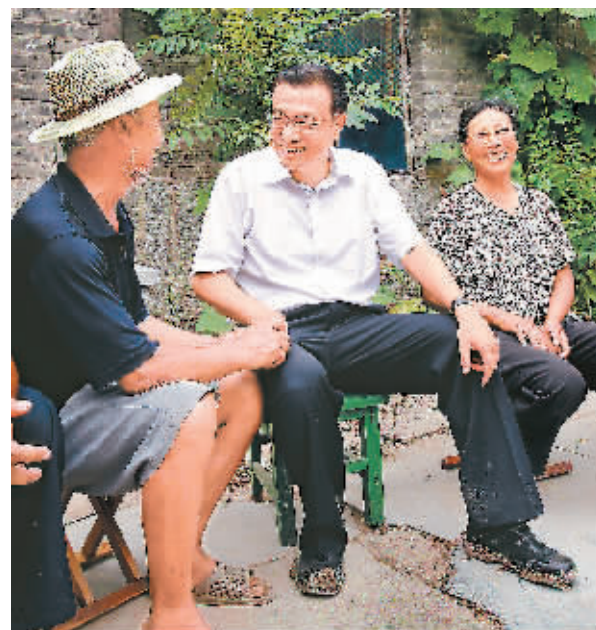
2010年7月8日,李克强在山东济宁市嘉祥县大孙村与贫困户孙树节一家亲切交谈。

随后,李克强在多个会议场合“打破沙锅式”的追问,引发广泛关注。这种长期形成的注重解决问题的务实会风,拒绝官