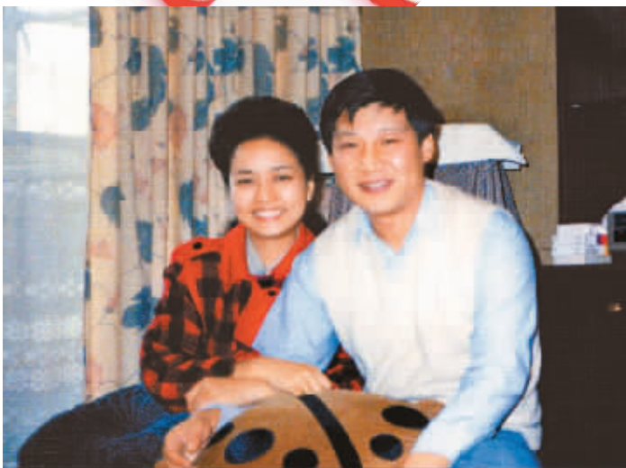
1989年9月，习近平和彭丽媛合影。

习近平的父亲习仲勋曾是中国党和国家领导人之一，不满21岁就担任陕甘边区政府主席，被毛泽东称为“从群众中走出来的领袖”。他从1962年起受到冤屈，长达16年之