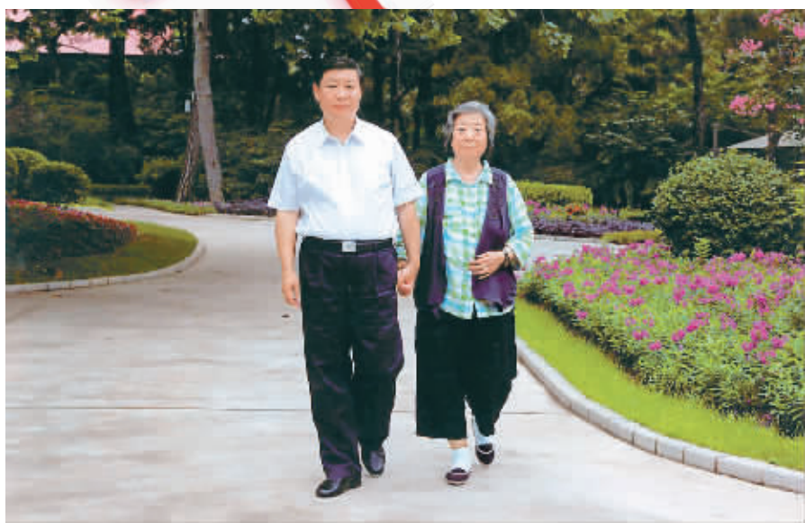
习近平陪母亲齐心散步。

在他主政期间，建设“四个浙江”的目标逐步实现。2005年浙江生态环境状况指数位居全国省市区第1位。2006年，群众安全感满意率达94.77%，浙江被认为是全国最具安全感的省份之一。2006年浙江可持续发展能力列上海、北京、天津之后居全国第4位。浙江在全国率先实现贫困县和贫困乡镇全部