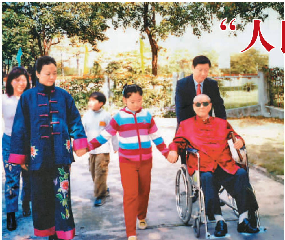
习近平一家三口和习仲勋在一起。