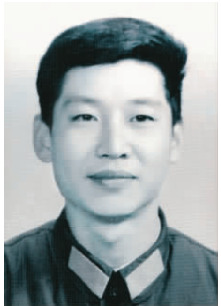
1979年，在中央军委办公厅工作时的习近平。

习近平的妻子彭丽媛是中国家喻户晓的著名歌唱家和歌剧表演艺术家。1980年，她代表山东代表团到北京参加全国文艺汇演，以歌曲《包楞调》、《我的家乡沂蒙山》震动京城音乐界。她是中国第一位民族声乐硕士，中国当代民族声乐代表人物，也是中国民族声乐学派创建者之一。她演唱的代表作品《在希望的田野上》、《父老乡亲》、《我们是黄河泰山》、《江山