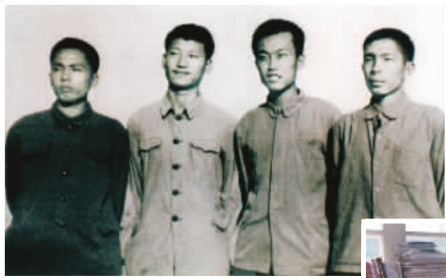
1973年上山下乡时期，习近平（左二）在陕西延川县。