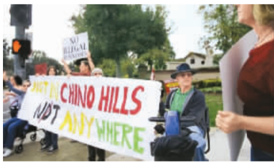
“月子中心”在美引抗议