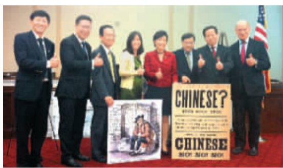
《排华法案致歉案》通过