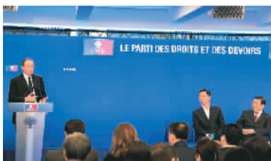
法国总统选举两大阵营向亚裔选民征求选票