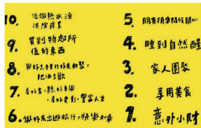
短片截图：10个“小确幸”