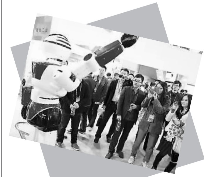
留交会上展出的新型机器人吸引眼球。