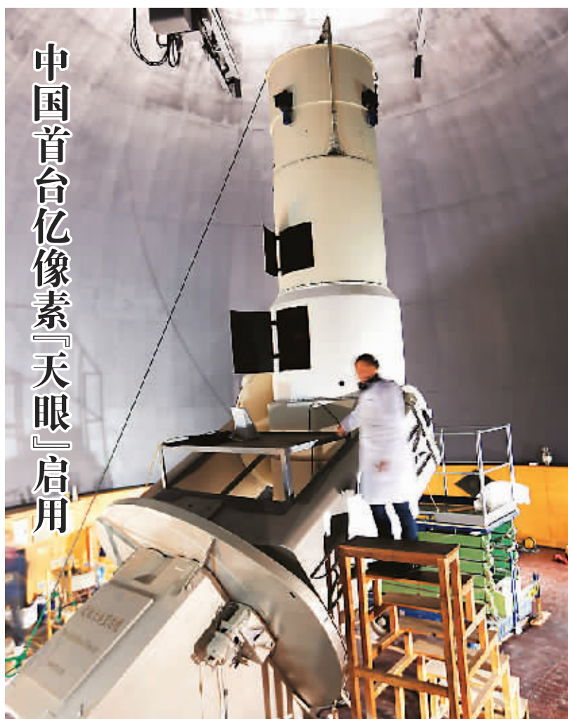
中国首台亿像素“天眼”启用 12月20日, 我国首台亿像素近地天体望远镜在中科院紫金山天文台江苏淮安盱眙县观测站安装调试成功并正式启用。这架口径为1.2米的施密特望远镜在该观测站原有1600万像素望远镜的基础上升级而成, 在经过为期4个多月的升级换代后分辨率达到1亿像素, 在世界同类型望远镜中处于领先水平。图为天文专家在安装调试亿像素近地天体望远镜。

贴政策, 积极推进种粮大户补贴试点, 逐步扩大补贴试点范围。 教育投入: 提高农村义务教育经费保障水平, 着力提升农村义务教育薄弱学校办学水平。落实农村义务教育阶段学生营养改善计划。全面落实国家资助经济困难学生政策, 促进教育公平。 医疗保障: 提高新农合和城镇居民医保财政补助标准, 支持开展城乡居民大病保险试点, 推动各项基本医疗保险制度相互衔接。适当提高人均基本公共卫生服务补助标准, 扩大免费服务范围。 社会保障: 巩固新型农村和城镇居民社会养老保险制度全覆盖成果, 研究建立企业退休人员基本养老金正常调整机制。适当提高城乡居民最低生活保障标准, 适时调整优抚对象等人员抚恤和生活补助标准。 保障房建设: 中央财政将继续大力支持保障性安居工程建设, 增加相关基础设施配套投入。实施相关税费减免优惠政策, 切实降低保障性安居工程建设成本。着力支持发展公共租赁住房, 加快推进棚户区和农村危房改造, 扎实推进游牧定居工程。 厉行节约: 严格控制“三公经费”支出, 深入推进会议费、差旅费管理和公务接待制度改革, 加强车辆编制管理, 严格按照标准配备车辆。继续严格控制修建楼堂馆舍, 严格控制新建楼堂馆舍。进一步清理规范庆典、研讨会、论坛等活动。