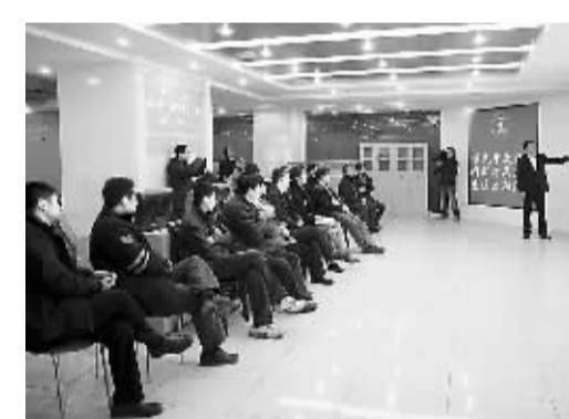
青岛市商务局举办肉类蔬菜流通追溯体系市民开放日活动。

而自活动开展几年来已累计征集意见建议5.3万件，其中2500多条已被采纳进青岛市政府工作报告、“十二五”规划和部门年度工作重点。