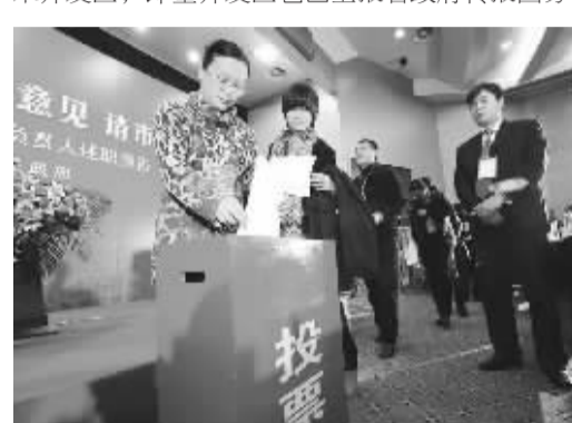
青岛市民代表进行测评投票。

“胶州经济开发区本月已获国务院批准为国家级开发区，这是青岛市的第二个国家级经济技术开发区，即墨开发区也已上报省政府转报国务院审批。”