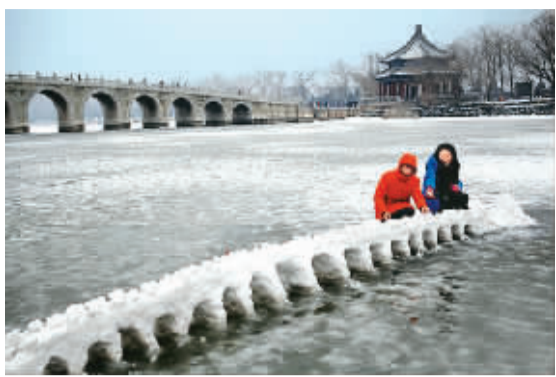
日前，连续两场降雪后的北京颐和园银装素裹，两名游客在颐和园十七孔桥前观赏雪版的“十七孔桥”。