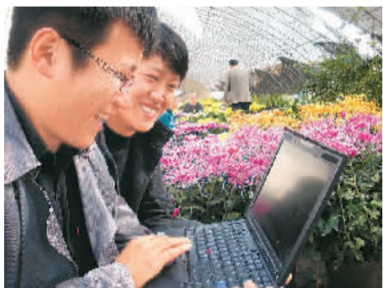
江苏省丰县组织开展“一名大学生村官一个项目”活动，凤城镇大学生村官选择回报率、销路相对畅销的花卉作为创业项目，成立了“大学生村官创业示范基地”，并不断扩大规模化发展，带动周边农户种植，利用网络销售。图为凤城镇大学生村官正在网上进行花卉销售。