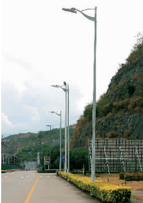
雷曼光电承担的大亚湾路灯项目

雷曼光电以技术立身、以品牌立名，致力于在中高端LED封装和显示、照明应用领域创新发展，为我国光电子高科技的发展作出了贡献。我们相信，雷曼光电将会用更优秀的LED产品照亮世界，成为一个受人尊敬的国际化LED民族品牌。