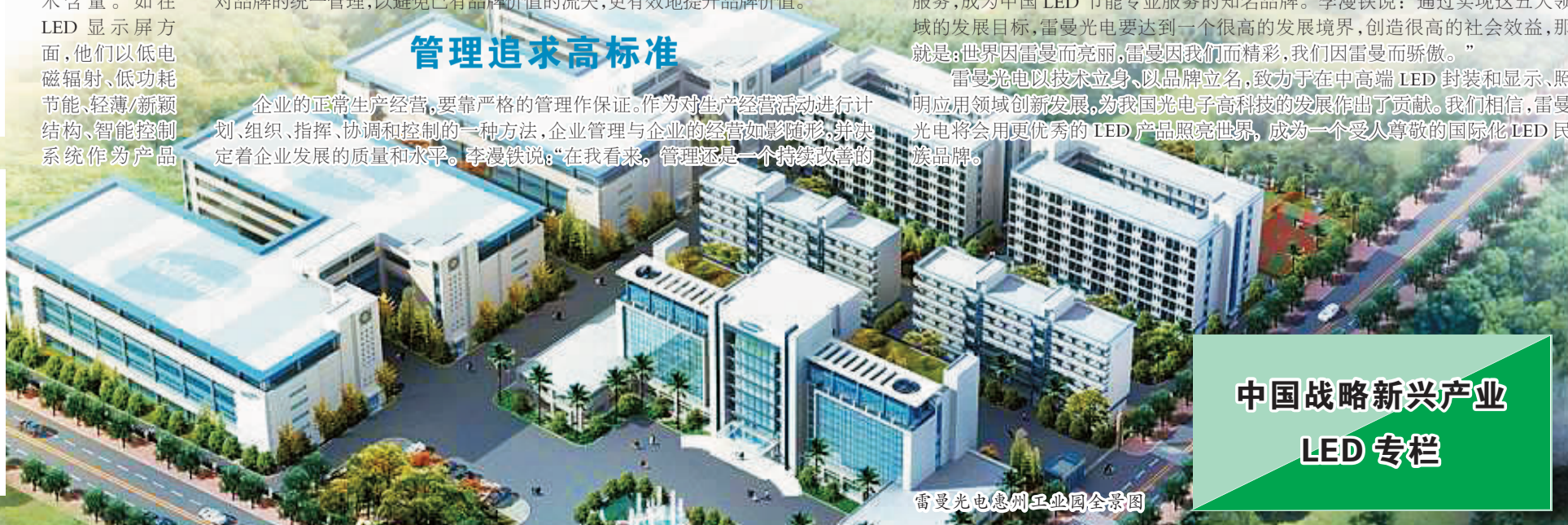
雷曼光电德州工业园全景图