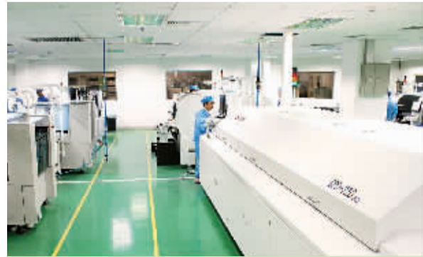
雷曼光电制造中心

雷曼光电拥有LED封装、LED显示屏、LED照明三大业务领域，其中LED封装是主攻的领域。在产品开发上，雷曼光电以高端的LED封装产品为基础，积极向高档次的LED显示屏、LED照明产品领域拓展，形成了从LED器件封装到LED显示屏、LED照明产品生产的较完整的体系。为了提高产品档次，他们一是提高产品的技术含量。如在LED显示屏方面，他们以低电磁辐射、低功耗、轻薄/新颖结构、智能控制系统作为产品